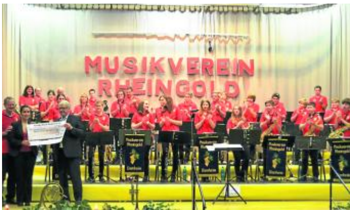
Anfänger und alte Hasen zeigten ihr musikalisches Können.

MUSIK – Jahreskonzert des Musikvereins Rheingold in Dienheim