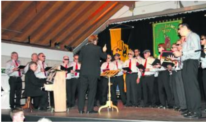
Der Männerchor des MGV 1884 Schwabsburg beim originellen Kriminaltango.

MUSIKALISCH – Musikalische Weinprobe des Männergesangsvereins Schwabsburg