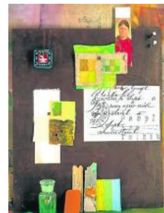
Bei der Gestaltung eines Objektrahmens sind der Fantasie keine Grenzen gesetzt.

Wandschmuck und zu einem echten Hingucker. Die Rückwand des Objektrahmens ist - mit Acrylfarben, hochwertigen Naturpapieren, eigenen Zeichnungen oder Fotos geschmückt - die Bühne für das eigentliche Geschenk. Anstatt zum Beispiel eine Halskette in einem einfachen Schmuckkästchen zu verschenken, wird sie kunstvoll in einem Objektrahmen ausgerichtet. Als Hintergrund kann eine Collage aus Bildern, Blumen oder Gedichten dienen. Objektrahmen gibt es in einer Größe von 13 mal 18 Zentimetern bis hin zu 70 mal 100 Zentimetern.