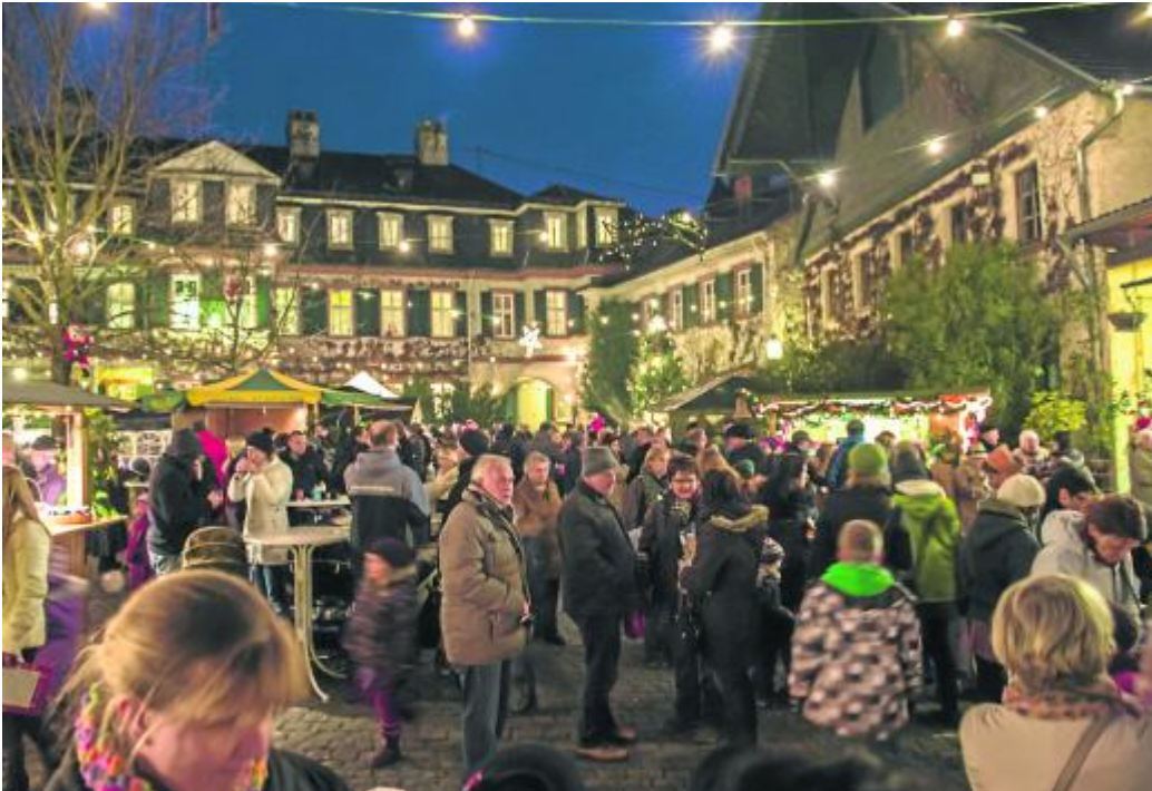
Weihnachtliche Stimmung kam im Ambiente des Schlosses von alleine auf.