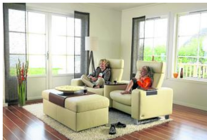
Heimkino: entspanntes Filmvergnügen für Groß und Klein.

MAINZ (djd/pt) - Smartphones, Tablet-PCs, E-Book-Reader und Flachbildfernseher dürften auch in diesem Jahr ganz oben auf der Liste der beliebtesten Weihnachtsgeschenke stehen. Häufig findet sich sogar ein ganzes Heimkino-System auf dem Wunschzettel - ein tolles Präsent für die ganze Familie, welches das Wohnzimmer nicht nur an den Feiertagen in einen ganz privaten Kinosaal verwandelt.